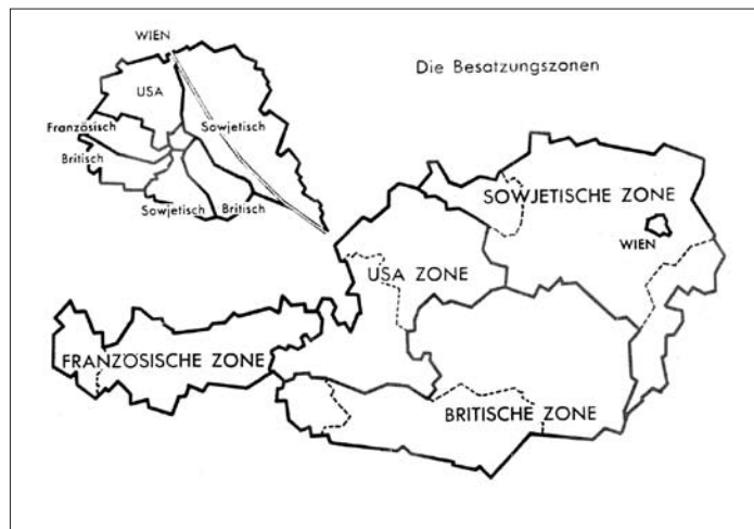
Quelle: Schatzkiste 4 – Handbuch für Lehrerinnen und Lehrer. E. DORNER: Wien 2001, S. 15

Österreich wurde von den Siegermächten (Frankreich, Großbritannien, Sowjetunion und USA) besetzt. Österreich war wieder ein eigenes Land, aber noch kein freies Land.